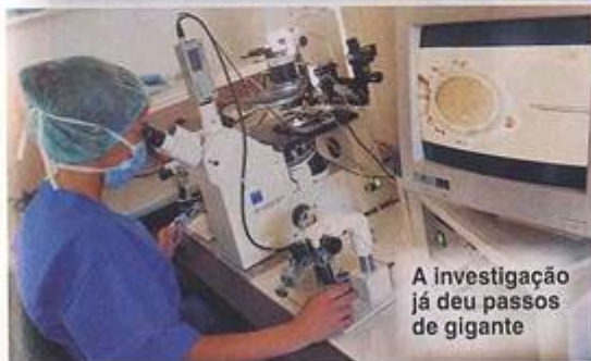
A investigação já deu passos de gigante

Muito antes de o bebé nascer, já se pode diagnosticar a trissomia 21 (também síndrome de Down ou mongolismo) pela análise do líquido em que o feto se encontra dentro do útero. Mas é mais provável surgir em grávidas depois dos 35 anos. A trissomia 21 é uma doença congénita devida a alterações na formação dos pares de cromossomas. Quando o espermatozóide do pai e o óvulo da mãe se juntam e as primeiras células se começam a dividir, no par de cromossomas nº 21, onde deviam ficar apenas dois cromossomas, ficam três (daí o nome trissomia 21). Esta anomalia leva a várias alterações do corpo (inserção baixa do cabelo na nuca, língua muito grande, etc.) e atraso mental (de grau variável, precisando de um ensino escolar especial), devendo ter apoio em consulta de Genética Médica. Um sinal muito característico é a pálpebra superior ter uma pequena prega junto ao nariz, parecida com o aspecto das pálpebras dos mongóis, na Ásia (o que deu origem ao nome mongolismo). Muitos pacientes conseguem ter vidas preenchidas e realizar-se profissionalmente. Aconselho uma visita ao sítio da Associação Portuguesa de Portadores de Trissomia 21 ( http://appt21.org.pt ).